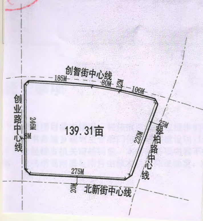
临渭区创新创业基地创新中学选址位置图