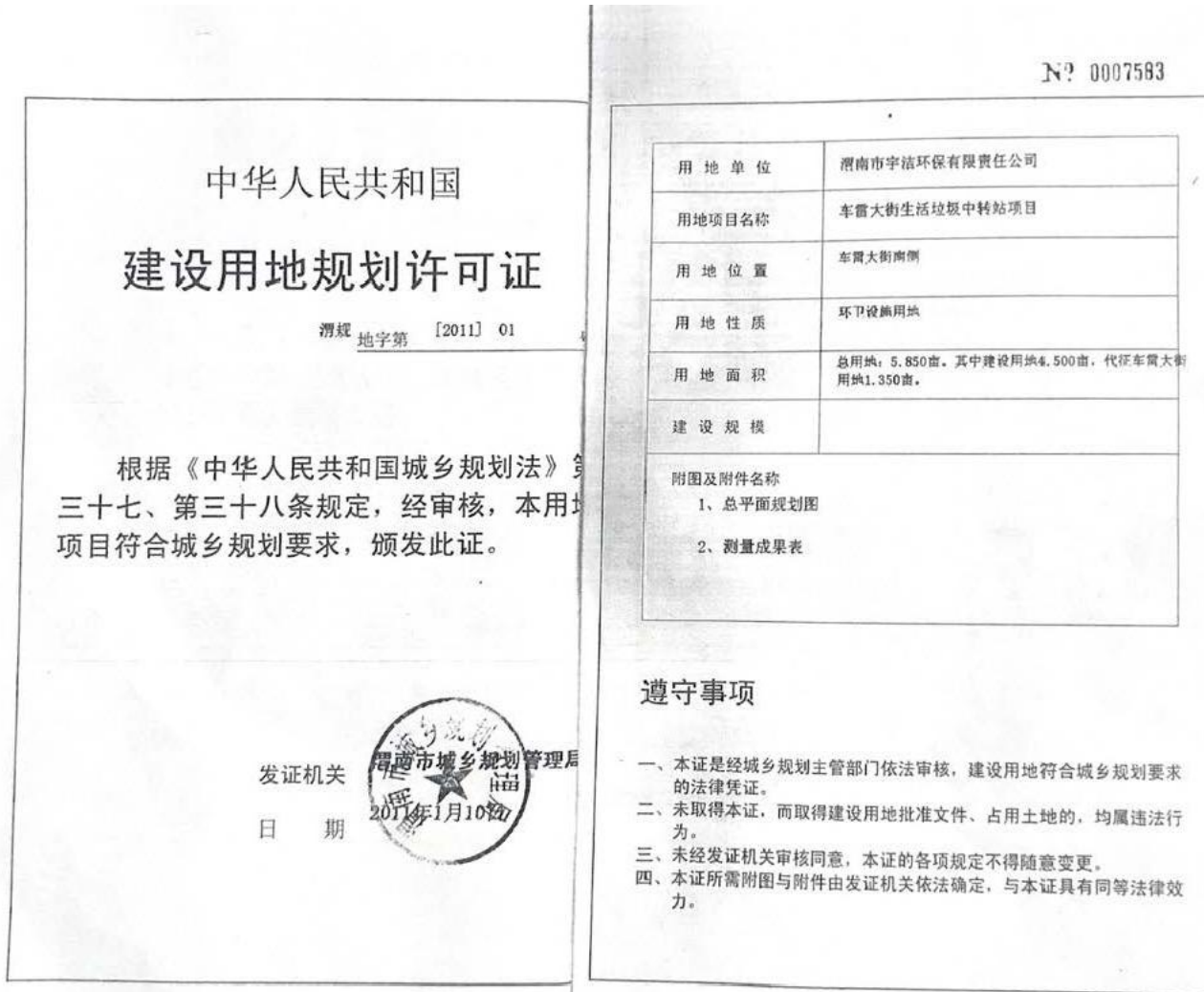
附件2 车雷大街转运站建设用地规划许可证