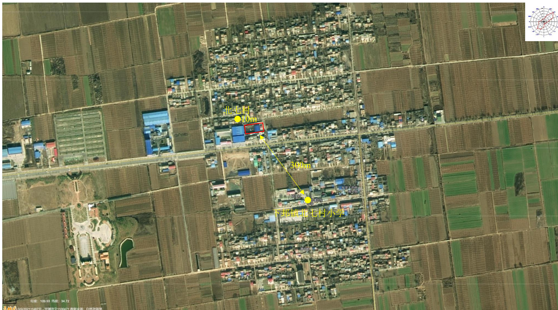
附图3 项目周边主要环境保护目标分布图