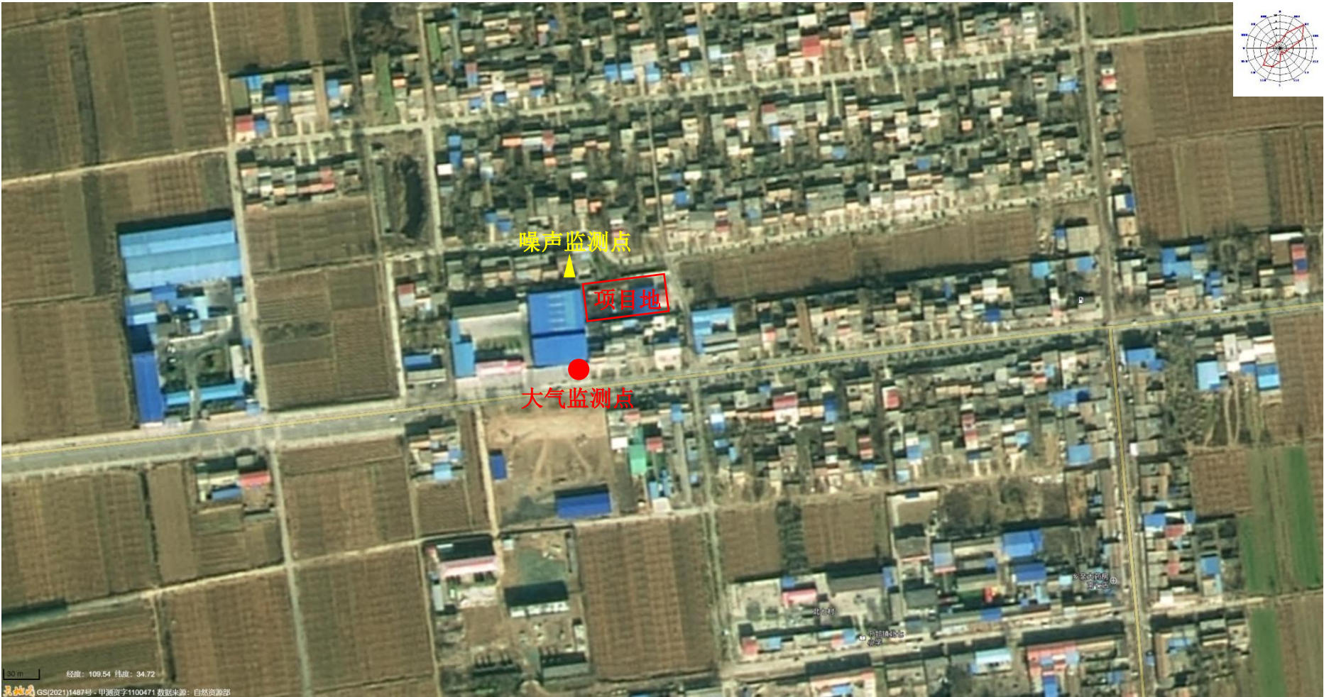
附图 5 项目现状监测点位图