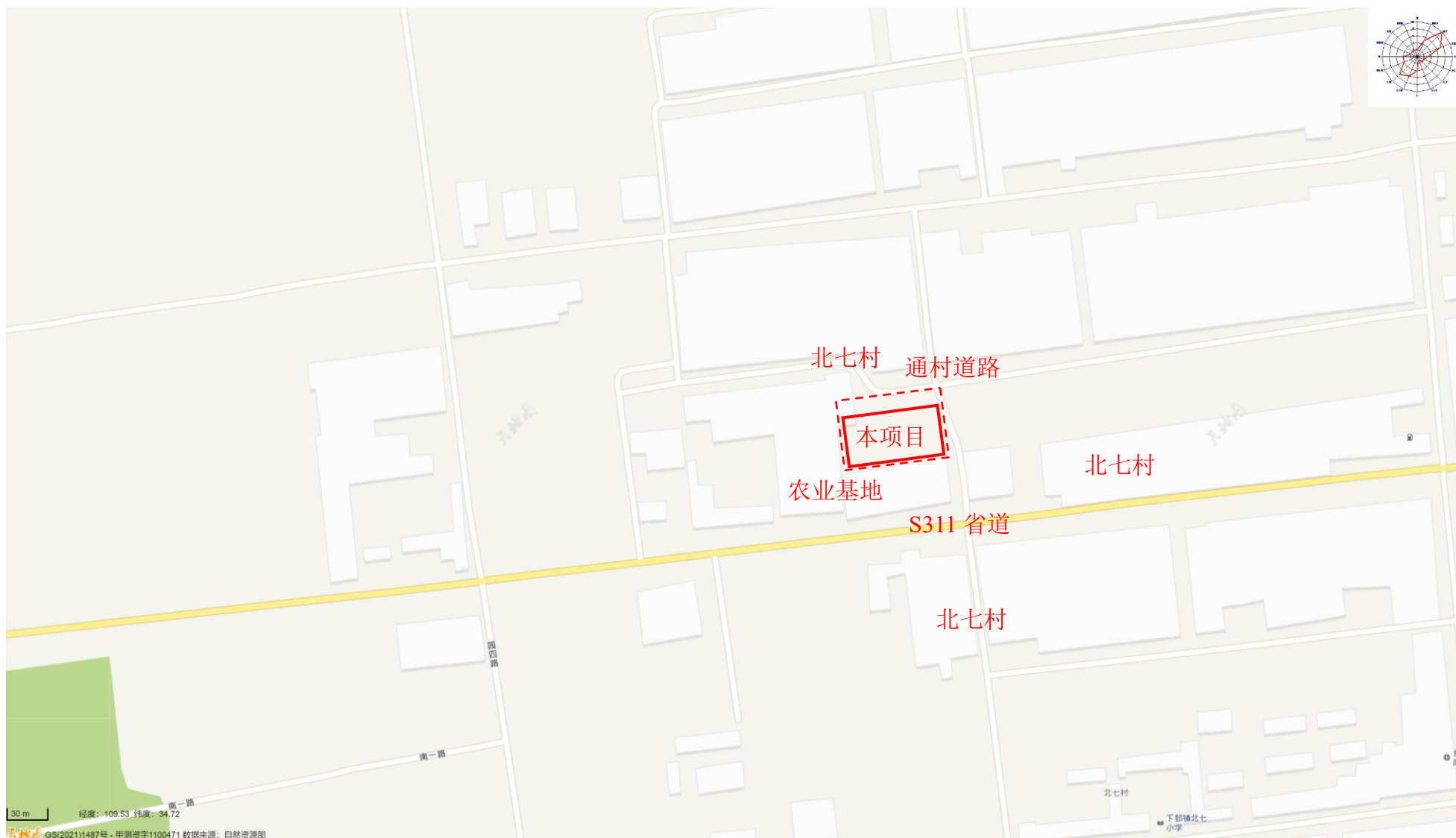
附图 2 项目四邻关系图